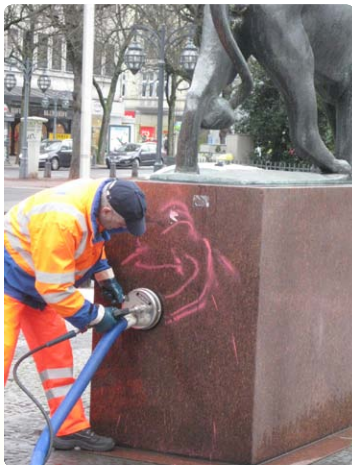
Es gibt immer und überall etwas zu tun: Reinigung eines Marmorsockels beim Dreck-weg-Tag

Um den Tag zu organisieren, bekommt Pro Düsseldorf in jedem Jahr massive Unterstützung von der AWISTA GmbH. Sie nimmt Anmeldungen entgegen, gibt Arbeitsmaterialien aus, holt und entsorgt die am Dreck-weg-Tag gesammelten Abfälle. Diese bereits bewährte Hilfe kommt von den Mitarbeiterinnen und Mitarbeitern der AWISTA GmbH. Auch mit besonderen Reinigungsaktionen beteiligt sich die AWISTA GmbH immer wieder am Dreck-weg-Tag. So wurde schon so manches Denkmal gereinigt und ekelig Klebriges mit dem „Gum-Buster“ entfernt.