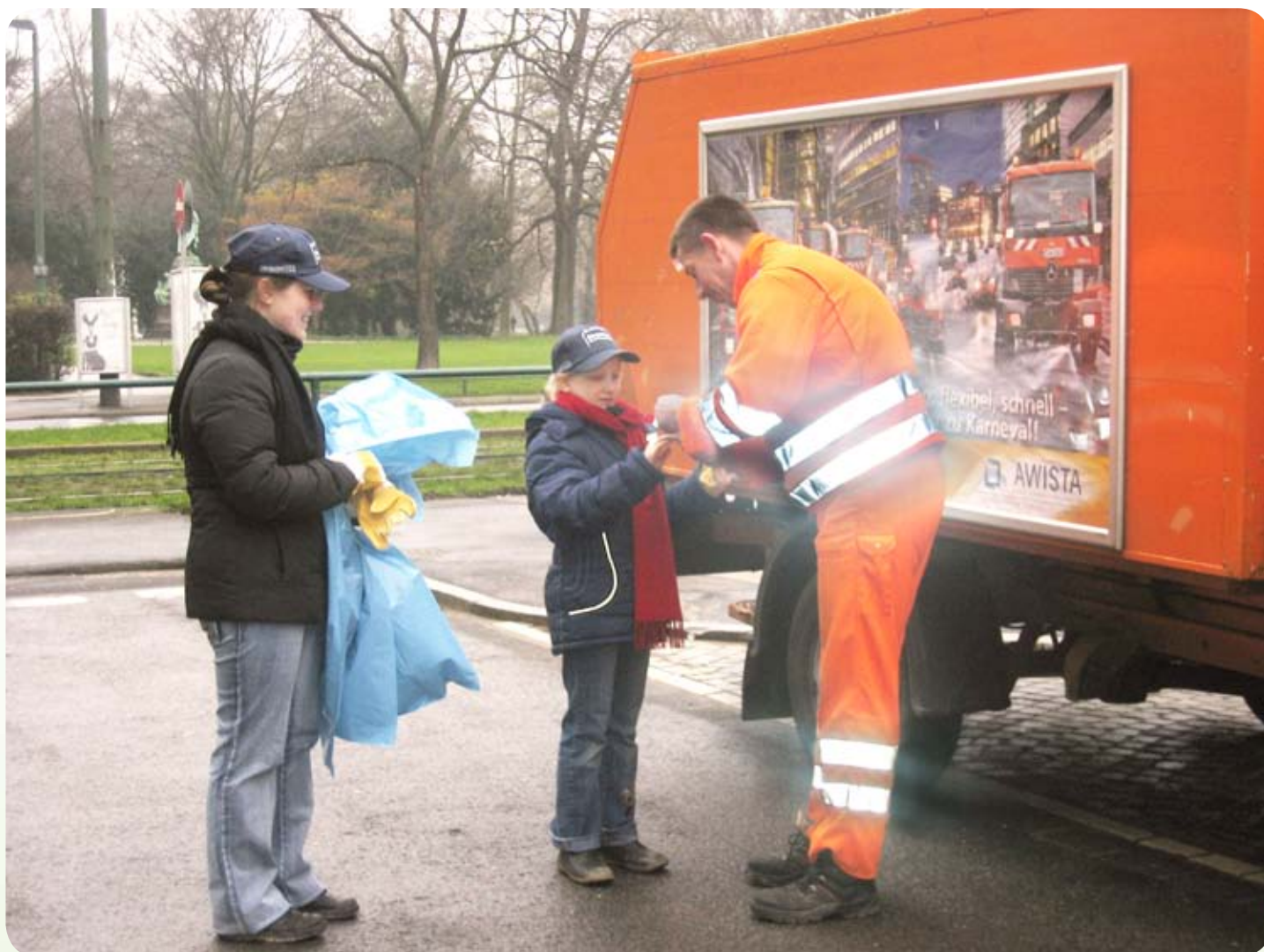
Jung und jünger, gemeinsam im Einsatz: Zwei Helferinnen des Dreck-weg-Tages bekommen ihre Arbeitsmaterialien von einem AWISTA-Mitarbeiter ausgehändigt

weg-Tages zu bearbeiten und zu vertiefen. Das Motto in diesem Jahr lautet: „Mein Weg nach Hause“. Alle Projekte werden im März in der Turbinenhalle der Stadtwerke am Höherweg 100 ausgestellt. Für die besten Projekte winken Preise von 200 bis 500 Euro.